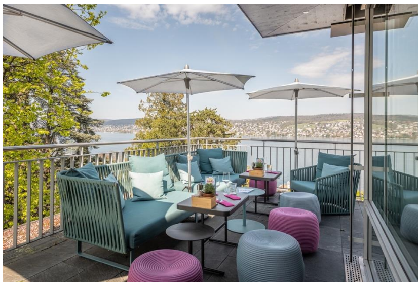
Die Popup Rooftop Sommerlounge ist während Juli und August täglich geöffnet.

Während den Sommermonaten, wenn die Location als Gästerestaurant fungiert, muss nicht auf kreatives Tagen verzichtet werden. Vor drei Jahren hat das Hotel Sedartis einen ersten Leuchtturm in der Seminarlandschaft erschaffen: den Kreativraum nach dem Ideation Space-Konzept von Witzig. Auch hier steht die Modularität des Raumes im Vordergrund, zusätzlich stehen den Gästen eine Vielzahl an Kreativ-Utensilien zur Verfügung, die Brainstorming und Ideenentwicklung auf ein ganz neues Niveau heben. Eine Indoor-Golfanlage rundet das Erlebnis ab.