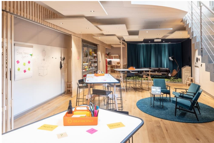
Im Kreativraum «Ideationspace» werden spielerisch neue Ideen entwickelt.

Das 4 Sterne Hotel Sedartis in Thalwil bietet nicht nur Stadtnähe, sondern auch eine atemberaubende Sicht über den Zürichsee. Das Hotel mit 40 modernen Zimmern in organischem Design und grosszügigen Balkonen ist nicht nur eine beliebte Adresse für Lifestyle-, Geschäfts-, Seminar- und Eventgäste, sondern erfreut sich auch bei Städtereisenden und Einheimischen grosser Beliebtheit. Die saisonale und regionale Küche punktet sowohl bei den Gästen wie bei der lokalen Bevölkerung. Für Seminare, Tagungen, Events und Feste stehen 10 topmodern ausgestattete Räumlichkeiten für Gruppen bis zu 150 Personen zur Verfügung, die beiden Perlen sind das neukonzipierte «Rooftop», sowie der Kreativraum «Ideation Space». Das Hotel Sedartis ist mit dem Label «Swisstainable» ausgezeichnet, das für nachhaltigen Tourismus in der Schweiz steht.